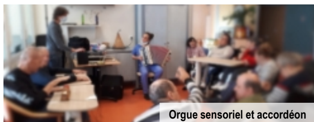
Orgue sensoriel et accordéon

La musique stimule ou apaise, elle donne envie de vivre !